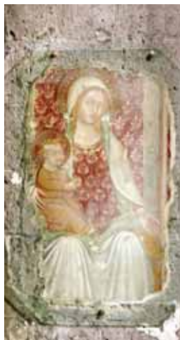
Duomo di Casertavecchia (affresco)

Resto tuttavia la Terra di Lavoro una delle terre più belle del Paese. Tradizionalmente più estesa del perimetro provinciale (nell'Ottocento arrivava, a nord, fino alle porte di Terracina) la provincia si può leggere in due ampi sottoterritori, il primo popoloso e agricolo, proteso verso il mare, il secondo che dal capoluogo si estende fino alle montagne. Due ambienti