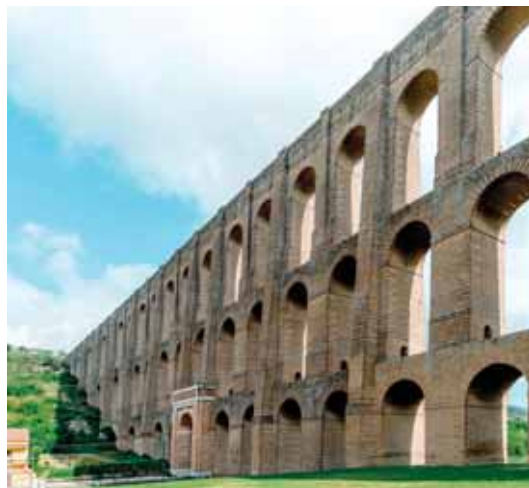
Ponti della Valle: Acquedotto Carolino