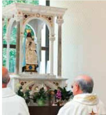
Madonna di Canneto

Il vescovo incontra i Diaconi permanenti con le mogli