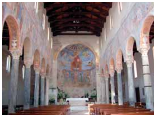
S. Angelo in Formis: Basilica (interno)

Ancora, il borgo medievale di Casertavecchia, a undici chilometri dal capoluogo, a quattrocento metri in collina. Qui il tempo che fu di Siffridina e del conte Francesco de La Rath, ciambellano della Regina Giovanna I di Napoli, si è fermato. Dove la valle appare distintissima, tanto ti sembra d'essere immerso nella storia.