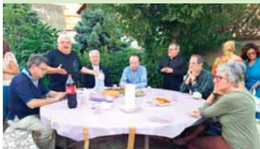
Parrocchia N.S. di Lourdes: agape fraterna