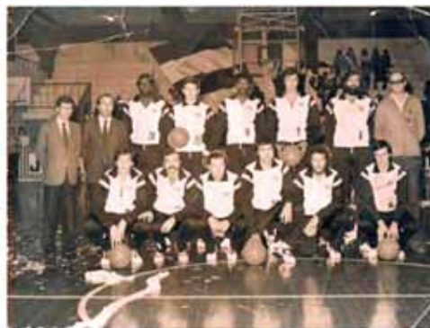
La squadra della Juvecaserta, 1978