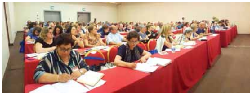
Caserta, Tulip Plaza: i convegnisti della XXI Settimana Biblica

Il prof. G. De Virgilio ha completato l'analisi con il commento del rito pasquale (Es 12), dell'evento della liberazione (Es 14-15) e dell'alleanza al Sinai (Es 19-24). La rilevanza dell'esperienza della liberazione è scolpita in un antico detto rabbinico che suona così: "quando un ebreo avrà dimenticato nel suo cuore l'esodo, avrà dimenticato di essere ebreo". In questa memoria così attuale, tante donne e uomini hanno potuto gustare la ricchezza della Parola spiegata e condivisa!