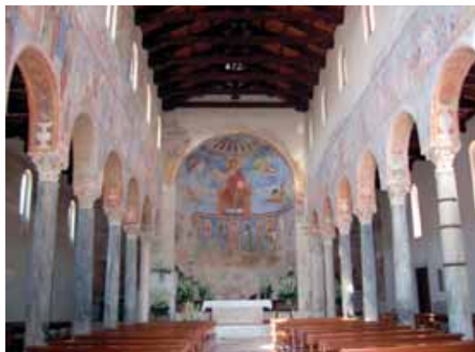
S. Angelo in Formis: Basilica (interno)