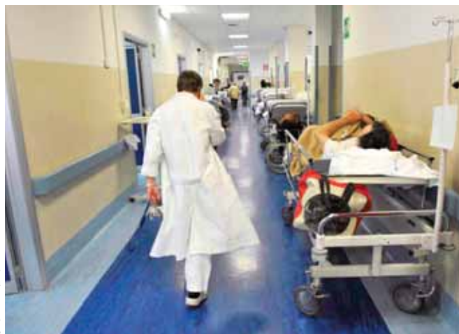
In alto a sx: Complesso dell'Ospedale di Caserta

sue necessità sono sempre al centro del nostro lavoro" . Dulcis in fundo, "so che se entro tre quattro mesi ci saranno miglioramenti di questa struttura il governatore De Luca verrà per una visita ufficiale a testimoniare l'attenzione dell'ente regionale verso l'ospedale di Caserta, che deve risorgere in prima istanza per l'alta qualità e l'alta specializzazione" , dice ancora il manager. "Questa è un'azienda di alta specializzazione e ha bisogno di crescere - ripete il dg dell'ospedale casertano -. I reparti devono aumentare l'occupazione dei posti letto, devono avere più efficienza, più produzione. Questo si potrà ottenere se ci sarà intensità in quello che si vuole, non con la medicina difensiva. La strada è irta di ostacoli, qualcuno creato ad arte, ma io ho il coraggio delle mie azioni. E chiedo a tutti la stessa ferma volontà" .