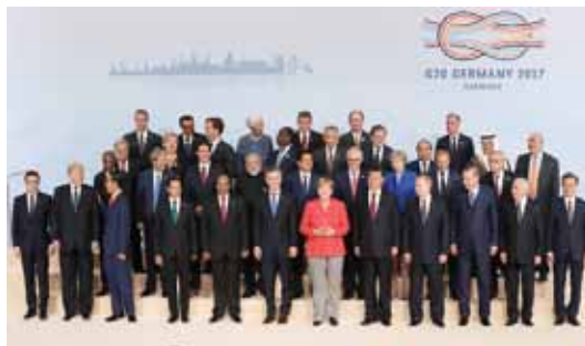
Amburgo, Germania: summit del G20

Abbiamo bisogno di elaborare un progetto politico di lungo periodo al quale ogni creden-