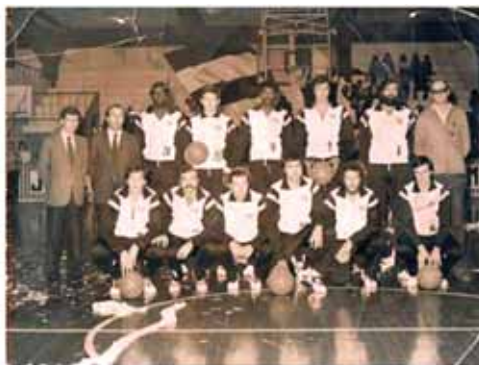
La squadra della Juvecaserta, 1978