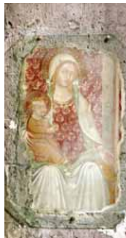
Duomo di Casertavecchia (affresco)

Resta tuttavia la Terra di Lavoro una delle terre più belle del Paese. Tradizionalmente più estesa del perimetro provinciale (nell'Ottocento arrivava, a nord, fino alle porte di Terracina) la provincia si può leggere in due ampi sottoterritori, il primo popoloso e agricolo, proteso verso il mare, il secondo che dal capoluogo si estende fino alle montagne. Due ambienti